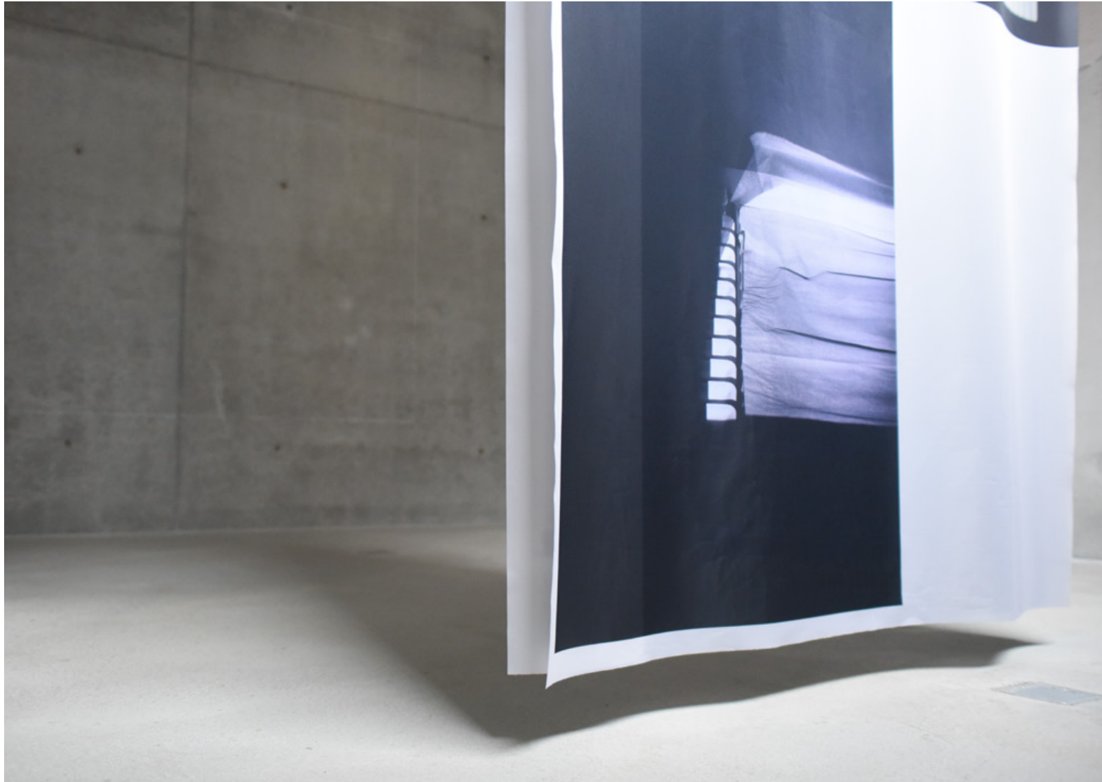
Ausstellungsansicht - Atelierhaus C21, Wien