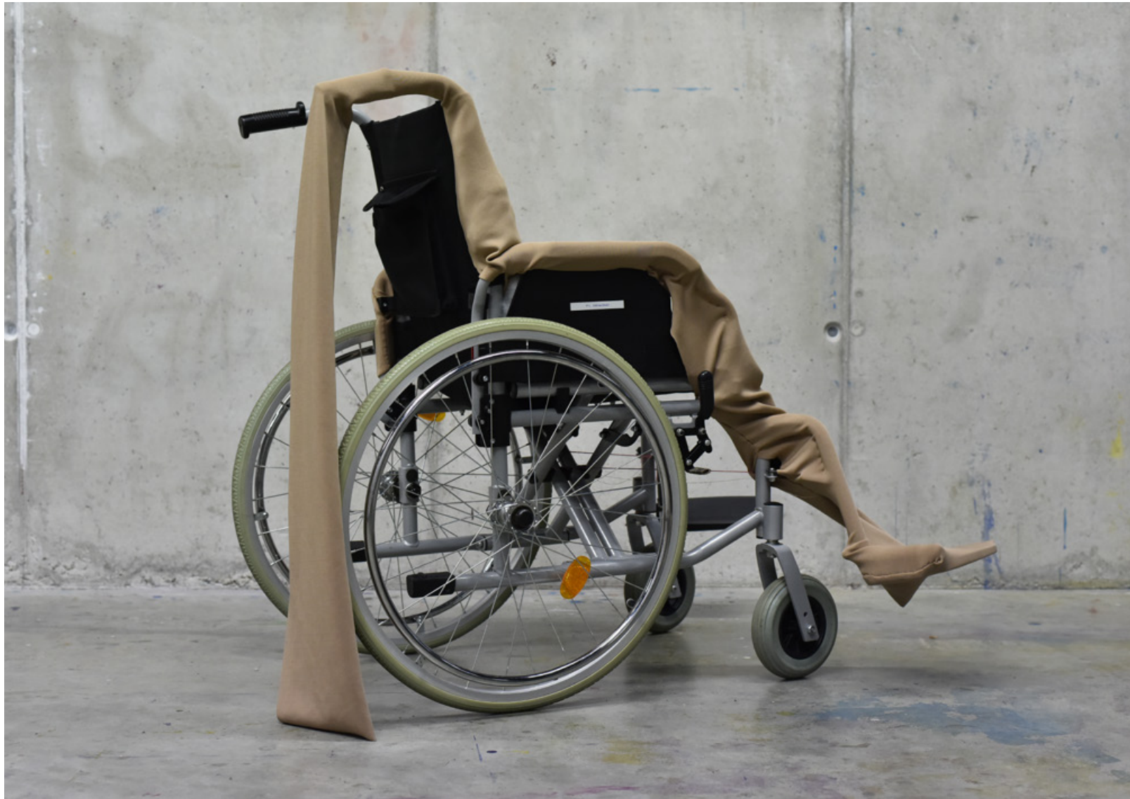
Ausstellungsansicht - Bella Martha, Grafrath, Deutschland