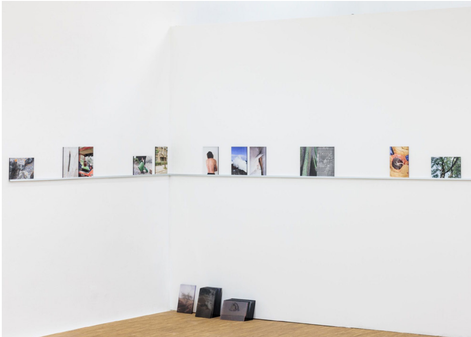
Ausstellungsansicht - Kunstverein Salzburg