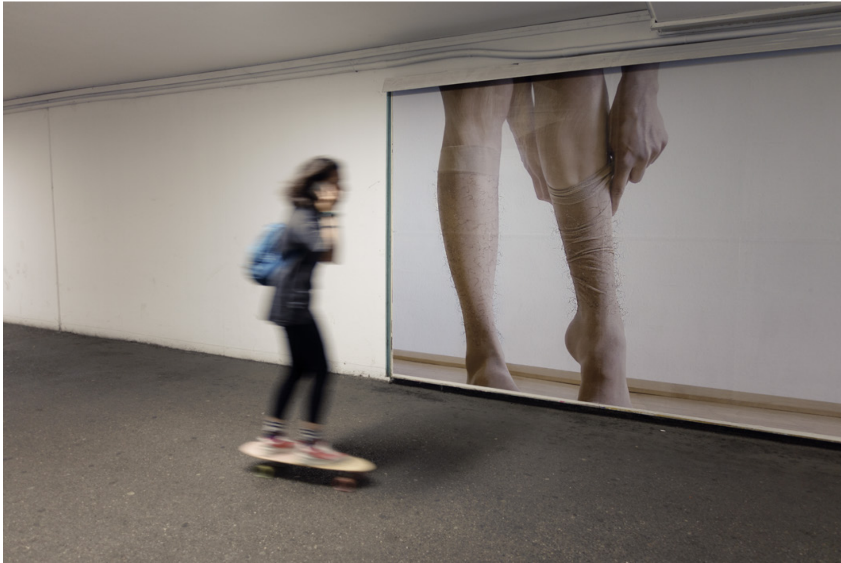
Ausstellungsansicht_Unterführung Hinsenkampplatz, Linz