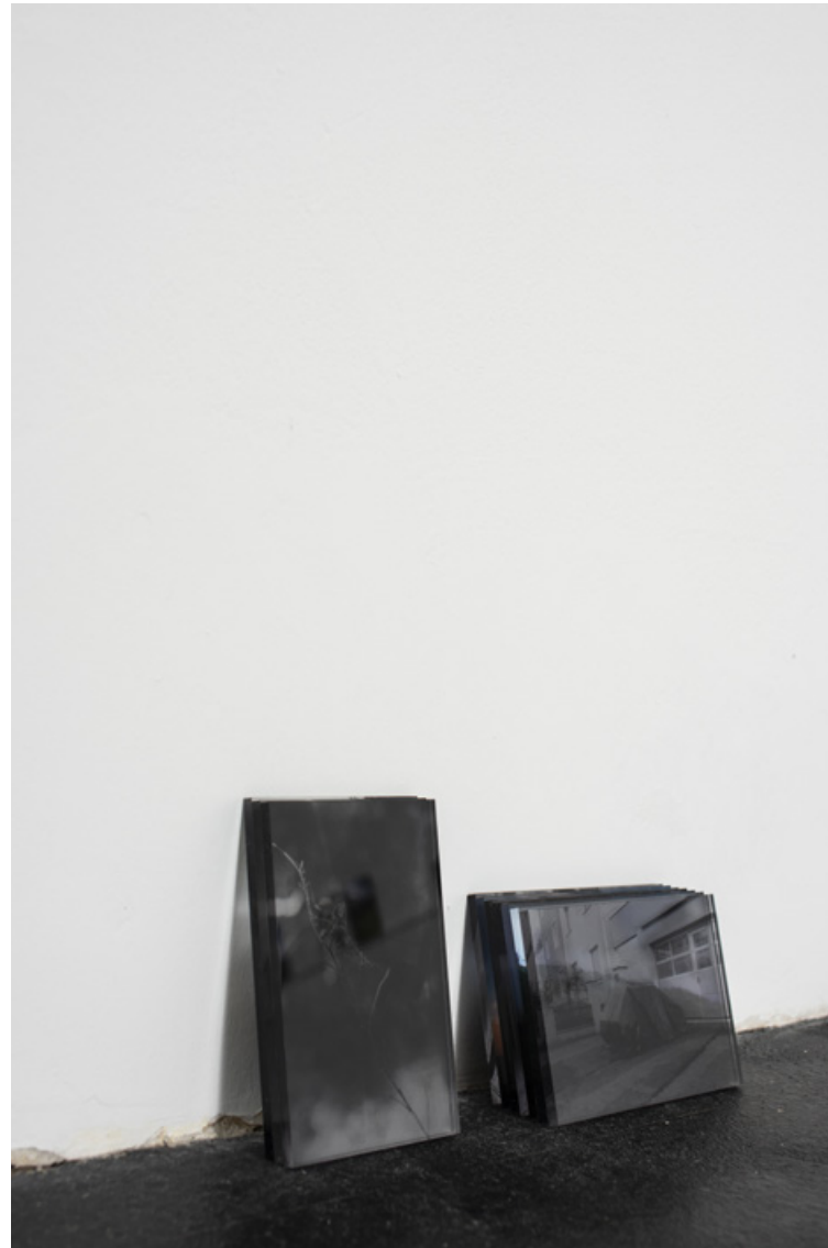
Ausstellungsansicht - Raumschiff, Linz