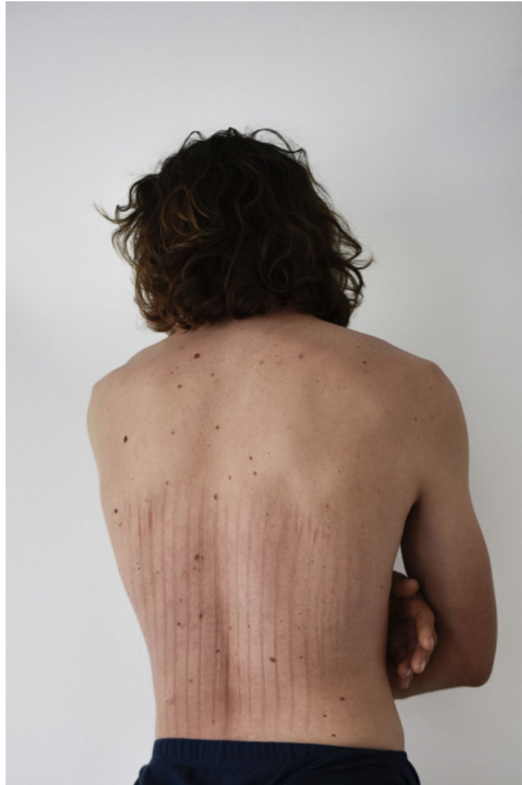
_aus der Serie you can only see it with closed eyes, 2025