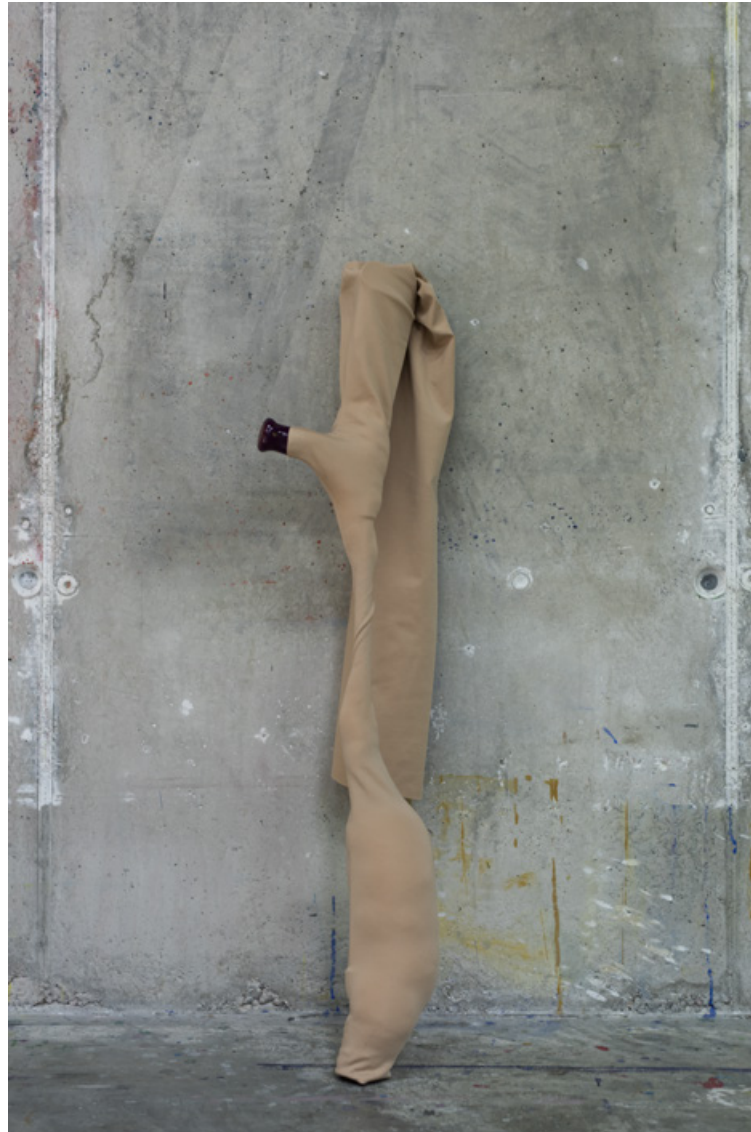
Ausstellungsansicht - Bella Martha, Grafrath, Deutschland