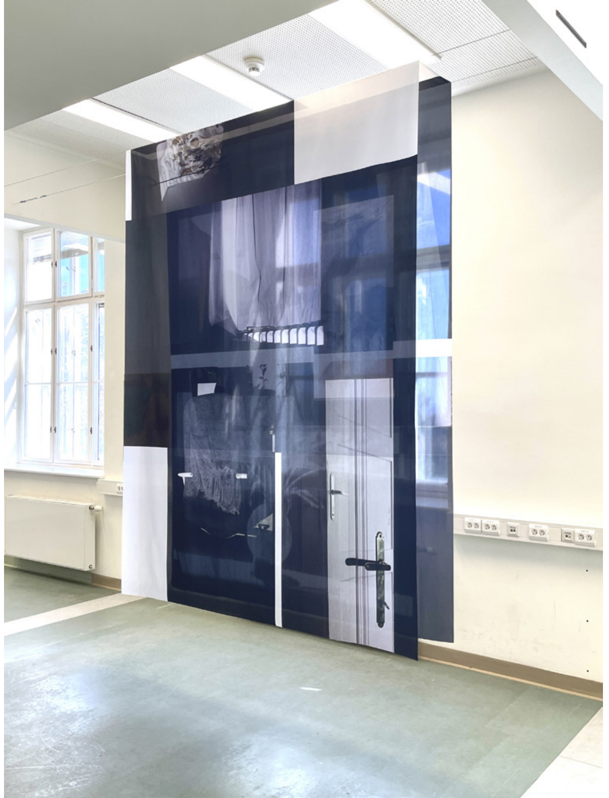
Ausstellungsansicht_Parallel Vienna Digitaldruck auf Textil 270 x 200 cm 2023