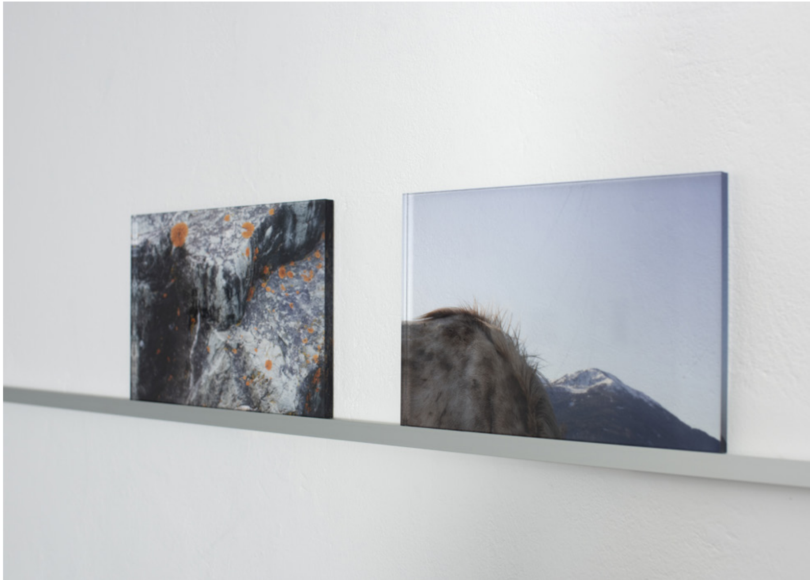
Ausstellungsansicht - Raumschiff, Linz